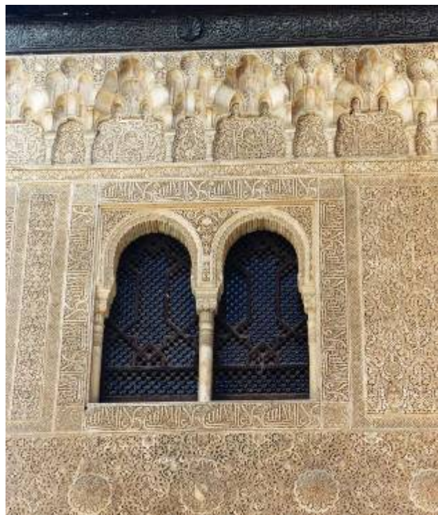
Alhambra, 2002 © Isabelle Poupart